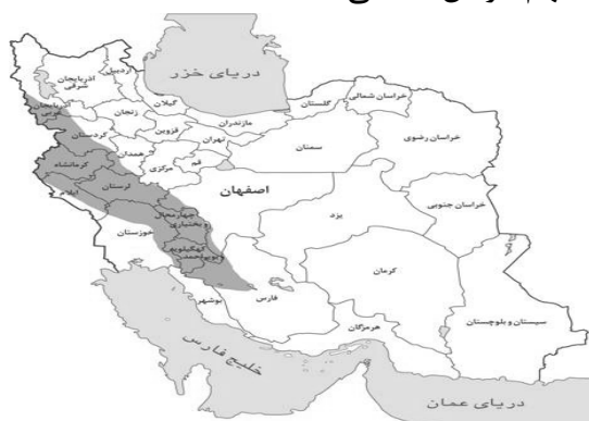
شکل ۱- ناحیه‌ی رویشی زاگرس

مثل خشکسالی و عوامل انسانی مثل آتش‌سوزی جنگل‌ها (۲۵)، ریشه‌کنی و بهره‌برداری نامناسب (۲۱) و غیره قابل توجه می‌باشد. گونه‌های جنگلی سابقه‌ی دیرینه‌ای در تغذیه و پروراندی دام‌ها دارند (۱۶، ۲۷) و در علم آگروفارستری یا بیشه‌زراعی که به تدوین روش‌های پایدار استفاده از سیستم‌های تولید به صورت تلفیقی می‌پردازد، تحت عنوان سیلوپاستورال شناخته شده هستند (۱۸). وسعت جنگل‌های ایران حدود ۱۳/۸۶ میلیون هکتار است که به دو بخش جنگل‌های مرطوب و صنعتی شمال و جنگل‌های نیمه مرطوب و حمایتی خارج از شمال تقسیم می‌شوند (۱۰). گونه اصلی این جنگل‌ها را بلوط تشکیل می‌دهد و پراکنش این جنگل‌ها در استان‌های آذربایجان غربی، کردستان، کرمانشاه، ایلام، لرستان، چهارمحال و بختیاری، خوزستان، اصفهان، کهگیلویه و بویراحمد و قسمتی از استان فارس است (شکل ۱) (۱۰).