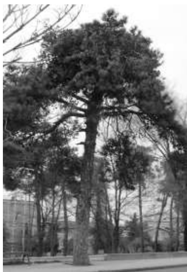
شکل ۵- خشک شدن تاج و رنگ پریدگی در برگ