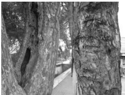
شکل ۸- وجود زخم و پوسیدگی درختان کاج

مشکلات ریشه‌ای شامل طیف متنوعی می‌باشد که از مهمترین آنها می‌توان به بیرون‌زدگی ریشه‌ها، قطع شدن آنها و پوسیدگی ریشه اشاره نمود (۲۵) نتایج نشان داد که ۱۳ درصد درختان کاج دارای بریدگی و بیرون‌زدگی ریشه با درجه خطر زیاد بودند. این مقدار بخاطر درست‌کردن چند باره جدول، آبیاری و عبور مردم که باعث فشرده شدن خاک و بیرون آمدن ریشه می‌شود که با نتایج Porhashemi et al. , (2012) برای گونه چنار در تهران همخوانی دارد. از مهم‌ترین مشکلات ریشه می‌توان به بیرون‌زدگی ریشه‌ها که باعث کنده شدن سنگفرش پیاده‌روها می‌شود و پوسیدگی شدید ریشه‌ها به دلایل مختلف از جمله به خاطر عبور و مرور وسایل نقلیه از روی آنها و یا