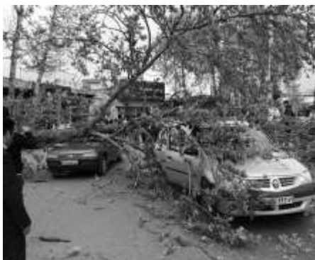
شکل ۷- افتادن درخت چنار در شهرستان بابل

هرس به موقع درختان خیابانی باعث کاهش مخاطرات و خطرآفرینی می‌شود (۲). معیار شاخه دهی نامناسب خوشبختانه در مورد درختان کاج تهران سهم چندانی در خطر آفرینی نداشته است. زخم و پوسیدگی از دیگر معیارهای خطرآفرین کاج تهران بودند که به ترتیب ۱۴ و ۱۷ درصد از کل تعداد درختان را به خود اختصاص دادند. در واقع با افزایش سن درختان کاج در محیط شهری، در اثر عوامل طبیعی یا انسانی این زخم ها یا پوسیدگی ها پیش می‌آید (شکل ۸) که وجود زخم در تنه امکان شکستن درخت از محل زخم را فراهم می‌سازد (۲۵).