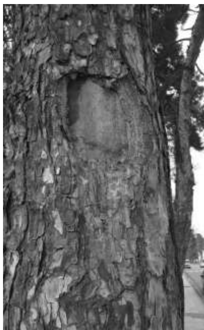
شکل ۳- زخم روی تنه

- خطر کم: خطوط انتقال برق با فاصله ۱۰ متری از درخت قرار دارد.