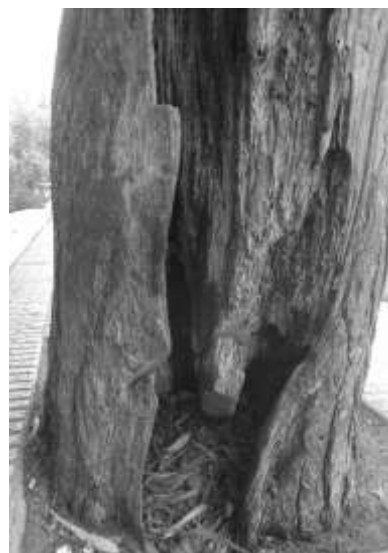
شکل ۴- شکاف عمقی

درختان دارای چه عیب‌هایی هستند. همچنین سهم هر یک از معیارهای خطرآفرین و درجه اهمیت آنها در درختان مورد مطالعه در جدول ۲ ارائه شده است.