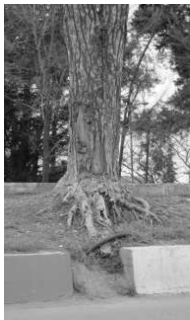
شکل ۲- بیرون زدگی ریشه ها از خاک

معیارهای در نظر گرفته شده بین صفر تا ۲۴ می‌باشد. بدین ترتیب هرچه این عدد بزرگتر باشد، میزان خطرآفرینی درخت بیشتر می‌باشد. سپس بر مبنای اعداد بدست آمده و براساس طبقه‌بندی تجربی به ۶ طبقه خطر آفرینی (جدول ۳) تقسیم شدند و نحوه توزیع درختان در طبقه‌های خطرآفرینی مشخص شد (۲۵).