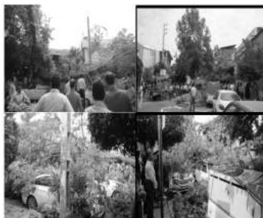
شکل ۶- افتادن درخت اوجا در شهرستان بابل

نتایج نشان داده است که ۱۰ درصد کل درختان مورد مطالعه (با درجه خطر زیاد) دارای شاخه و سرشاخه های خشکیده بودند که احتمال شکستن آنها در برابر وزش بادهای شدید بسیار زیاد است.