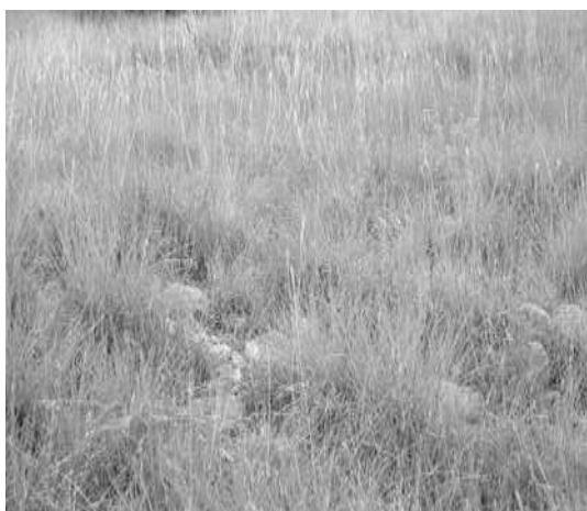
شکل ۱- گونه B. ischaemum در استان گلستان

برای رویش گونه مربوطه فراهم می‌کنند. در خاکهای مورد آزمایش حداقل و حداکثر هدایت الکتریکی به ترتیب ۰/۶ و ۰/۸ دسی زیمنس بدست آمد که نشان‌دهنده حضور گیاه در خاک‌های غیر شور و یا خاک‌های با شوری بسیار کم است. میزان اسیدیته خاک‌ها از ۷/۴ تا ۷/۷ متغیر است که در کلاس غیر قلیایی قرار می‌گیرد.